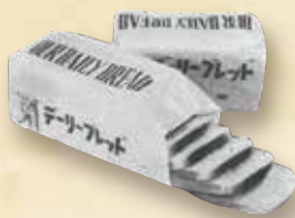
日本初のスライス包装食パン