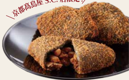
根菜と8穀の竹炭カレーパン

2023年10月17日(火)、京都四条河原町に開業の「京都高島屋 S.C.」内 専門店ゾーン [T8] 地下1階に、新しい進々堂がオープンいたします! 進化する「進々堂 京都高島屋 S.C. 店」に、ご期待ください!