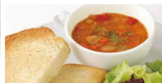
スープモーニングセット ミネストローネ Minestrone soup plate set ¥900