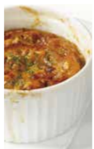
オニオングラタン スープ Onion Gratin Soup ¥650