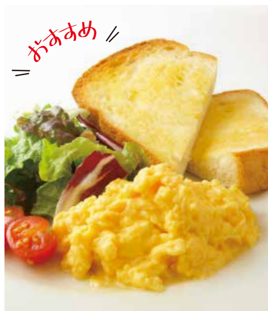
スクランブルエッグセット Scrambled eggs plate set ※トーストには無塩バターを塗っております。 ¥950