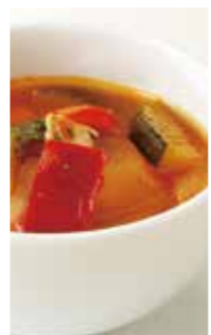
ミネストローネ Minestrone (ボウル) ¥600 (カップ) ¥400 ¥393