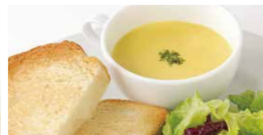
スープモーニングセット とうもろこしのスープ Corn soup plate set ¥950