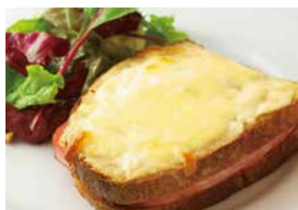
パン・ド・カンパーニュの クロックムッシュセット Pain de campagne "Croque monsieur" set ¥1,100