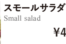
スモールサラダ Small salad ¥450