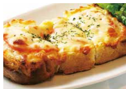
チーズトーストセット Cheese toast set (辛子マヨネーズ使用) ¥900