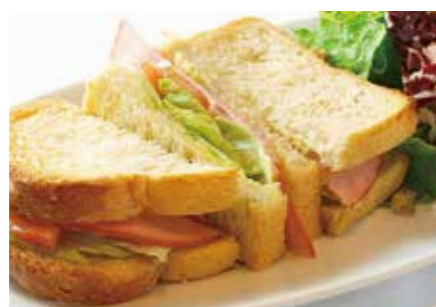
ハムトーストサンドセット Ham toast sandwich set ¥950