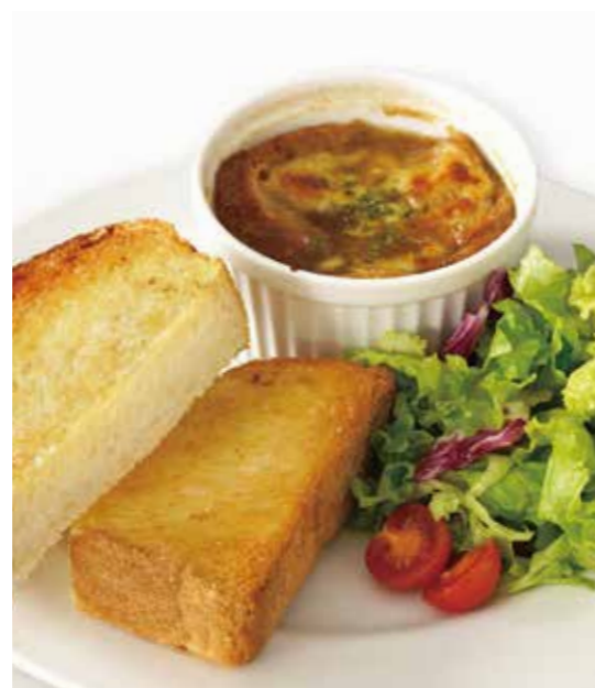
スープモーニングセット オニオングラタンスープ Onion gratin soup plate set ※トーストには無塩バターを塗っております。 ¥1,050