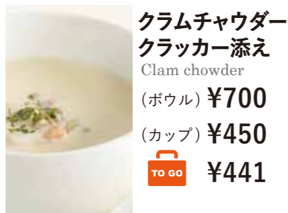
クラムチャウダー クラッカー添え Clam chowder (ボウル) ¥700 (カップ) ¥450 ¥441