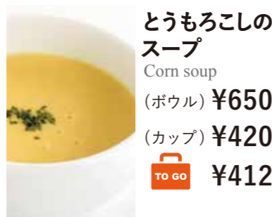
とうもろこしの スープ Corn soup (ボウル) ¥650 (カップ) ¥420 ¥412