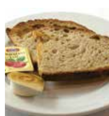
コティディアン(田舎パン) Pain de campagne "Quotidien"