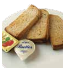
全粒生活パン・ド・ミ Whole wheat pain de mie