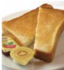
プルマン White bread

トーストセット ○お好きなパンを5種よりお選び下さい。 Plain toast with drink (ドリンク付) ¥650 ※いずれかのセットメニューをご注文のお客様は、単品(¥300)でもご注文いただけます。