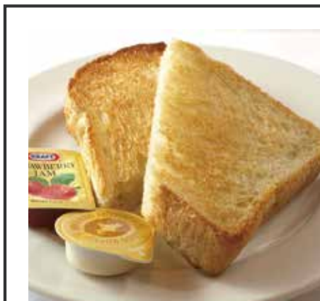
パン・ド・ミ Pain de mie

進々堂自慢のバゲットに、卵、ミルク、生クリームをしみこませ、バターで焼き上げフレンチトーストに。 ベリーのコンポートを添えたヨーグルトとどうぞ。