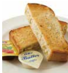
雑穀生活 Multi cereal bread